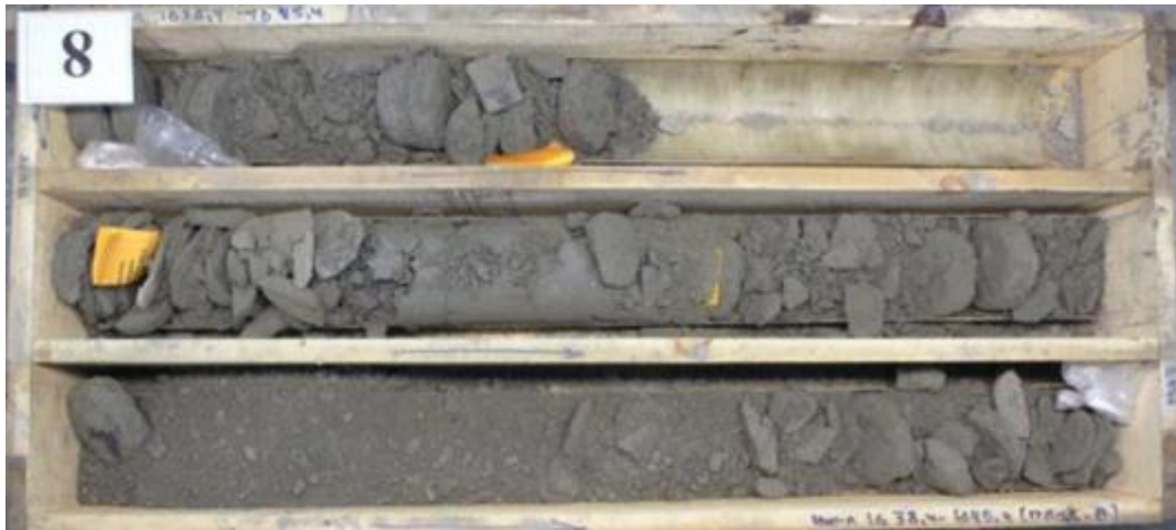
Рис. 3 Пример керна, отобранного с нарушениями технологии отбора по изолированной технологии (раздробленный керн)