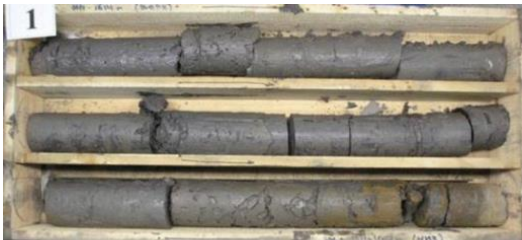
Рис. 2 Пример керна, отобранного с нарушениями технологии отбора по изолированной технологии (толстая глинистая корка)

8.20. При неправильной организации работ и несоблюдении требований настоящего Положения, отбор керна приводит к потере качества керна, примеры низкого качества показаны на рисунках 2-6.