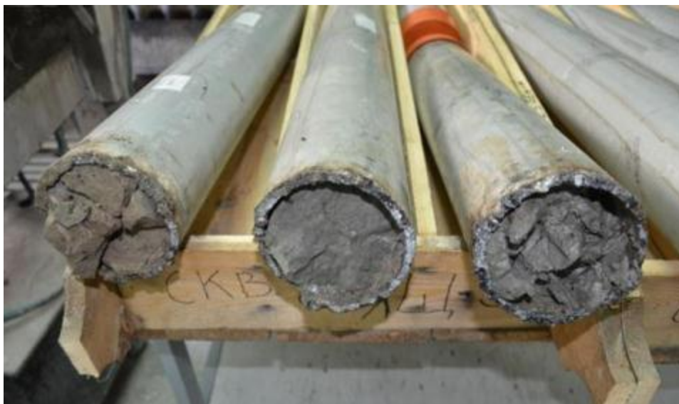
Рис. 6 Пример керна, сегментированного с нарушением требований по отбору керна (сегментирование выполнено с применением газосварочного оборудования)

8.21. Для минимизации рисков простоя бурового подрядчика, завоз необходимого оборудования необходимо осуществлять заранее, до начала работ по отбору керна, при этом необходимо наличие не менее двух комплектов оборудования (бурильные головки, КОС и т.д.).