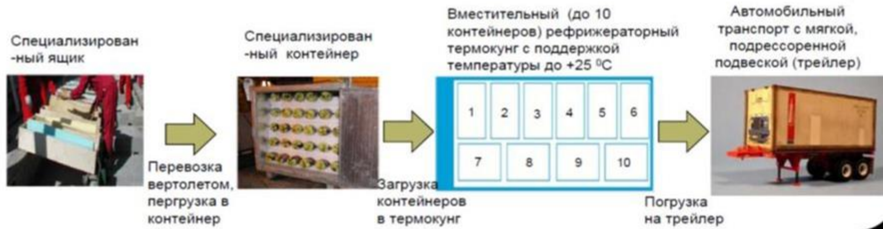
Рис. 7 Типовые схемы транспортировки неконсолидированного керна