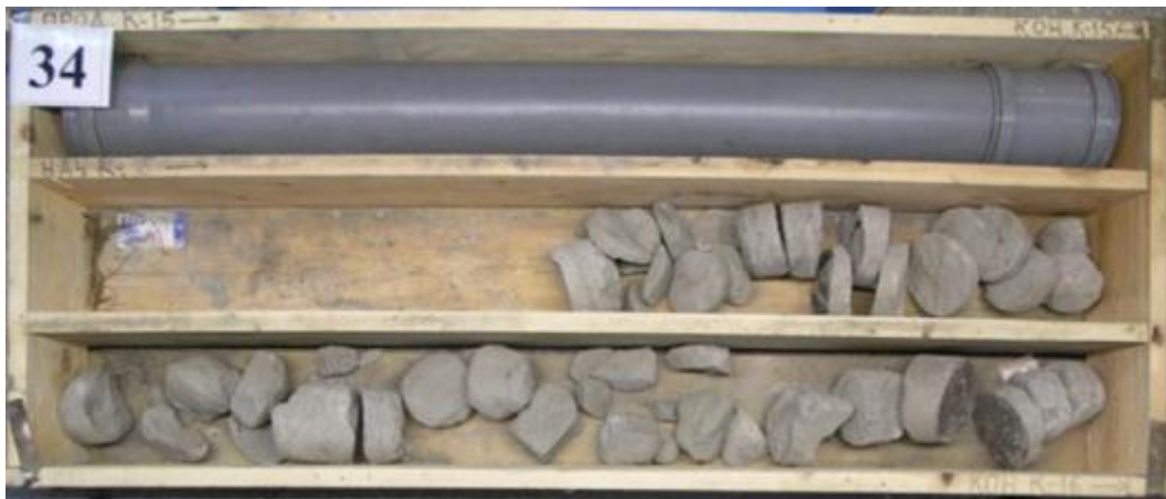
Рис. 4 Пример керна, отобранного с нарушениями технологии отбора по обычной технологии (уменьшение диаметра керна, большая сегментация)