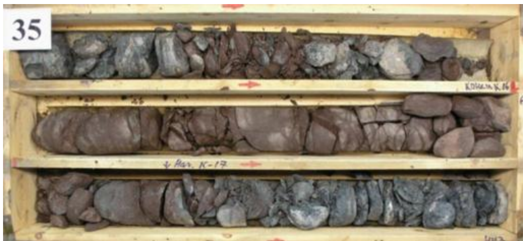
Рис. 5 Пример керна, отобранного с неправильно подобранным породоразрушающим инструментом (большая сегментация)